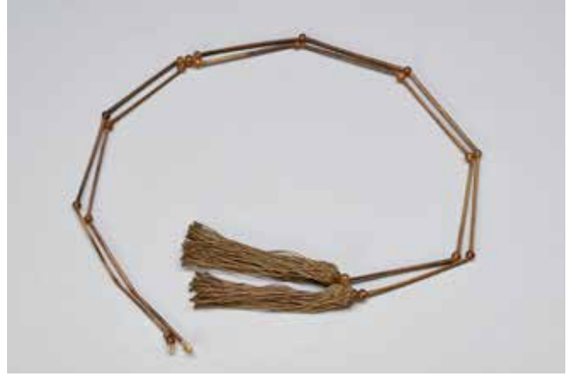
Cordón de sombrero , Corea ca. 1857, periodo Joseon. Bambú. Donación de la Colección de Bambú Lutz, 1983.526.