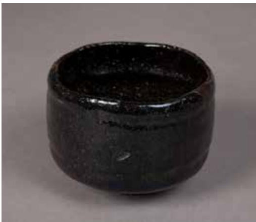
Tazón de té, Japón, s. XVIII, periodo Edo. Loza con barniz. Denver Art Museum: Obsequio del Sr. Ramsay Harris y esposa, 1993.12.

Echa un vistazo a otros objetos del Denver Art Museum que destacan algunas de estas ideas de belleza: