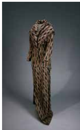
Issey Miyake, Saco con bustier transformable y falda asimétrica , Colección Otoño-Invierno 1986-1987. Ikat japonés sobre algodón y seda. Colección Textil Neusteter en el Denver Art Museum: Adquirido por varios donantes por intercambio, 2016.91A-B.